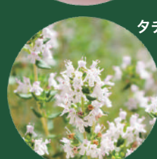
タチジャコウソウ油