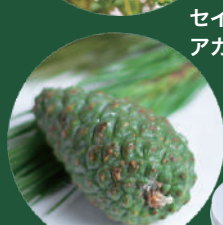
セイヨウアカマツ球果油