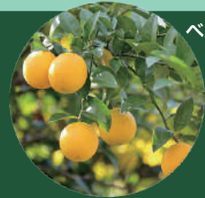
ベルガモット果皮油